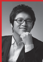
강찬 대표곡: 섬김