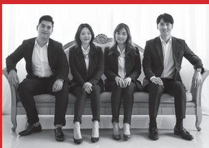
HisWill 대표곡: 나도 바보처럼 살래요