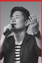
박요한 대표곡: 예수, 나의 가장 큰 힘