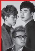
라스트 대표곡: The Cross