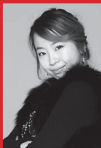
지미선 대표곡: 할렐루야